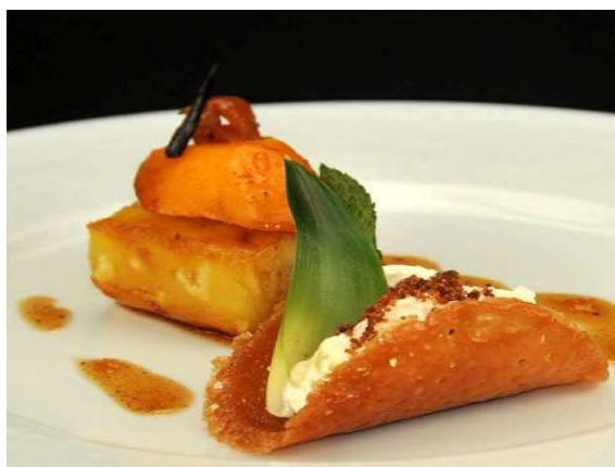
Mangue et ananas rôtis au gingembre, tuile croustillante à l'orange.