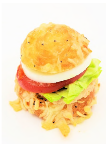
Petit chou version Bagnat (tomate, œuf dur, salade, thon, tapenade de poivron rouge et basilic)