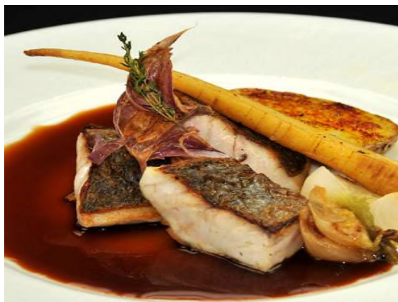
Daurade à la plancha, réduction de jus de crustacés, poêlée de légumes d'antan.