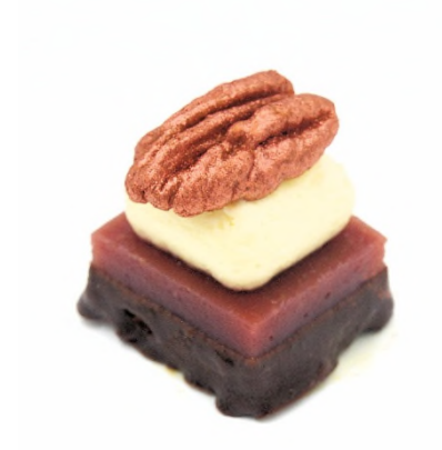
Compression de figue et noix, tendre coussin au lait d'amande douce