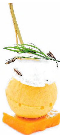
Cheese cake de carotte, mini macaron au cumin d'été