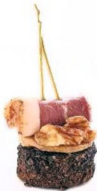
Polenta black, magret de canard au cèpes et noix du Périgord