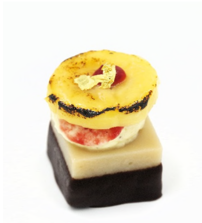
Banana split, confit de fraise des bois, sifflet de Freyssinette