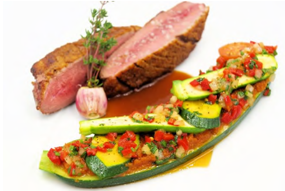
Magret de canard gras rôti au thym frais, petit jus corsé, poêlée de légumes méditerranéens.