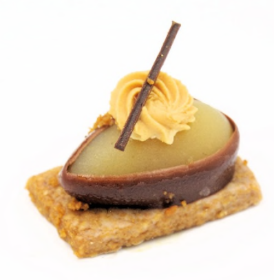
Quenelle de poire au caramel beurre salé, glaçage gianduja