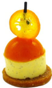
Tarte vanille Bourbon, confit d'argousier, voile de kumquat