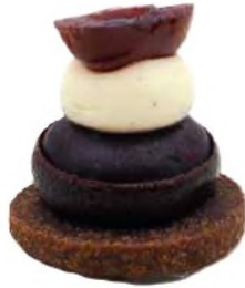
Coussin de griottes inspiration forêt noire, chantilly vanille bourbon