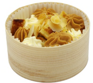
Nage de fruits au basilic (Pêche, abricot, melon, pastèque)