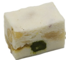
Nougat de chèvre, pistaches, noisettes et cranberries