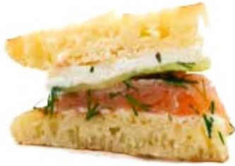
Pain blinis, saumon fumé à l'aneth et concombre, crème de raifort et citron yuzu