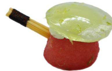
Pic melon pastèque à l'eau de menthe