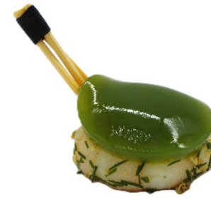
Crevette à l'aneth, tomate à l'eau de fenouil et basilic