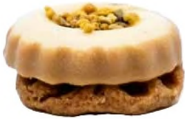
100 % miel : bruyère, garrigue et pollen