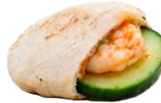
Mini pita, crevette et concombre, pulpe d'avocat, tomate, jalapenos et coriandre