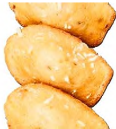
Madeleine cheddar emmental