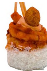
Perle de tapioca à la noix de coco, crevette au saté