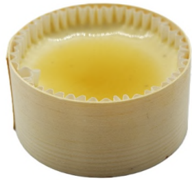
Crème caramel, vanille intense