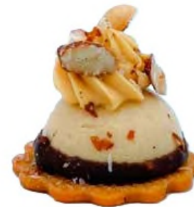
Dôme Dulcey, glaçage gourmand