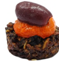
Sablé 100% végan, tapenade de poivron et olive de kalamata