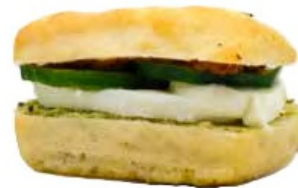
Mini focaccia mozzarella fior di latte, courgette, pesto verde, tomate et olive