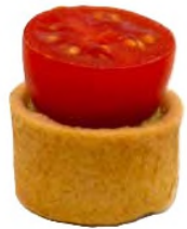
Petit bouchon de tomate datterino au pesto