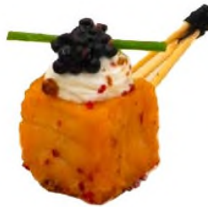
Kub de saumon frais ciboulette, crème de raifort au yuzu