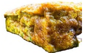
Tortilla de patatas, oignons frits, petits pois et piquillos, tapenade de poivron rouge (80 à100 pièces, 1 à 1,1kg)