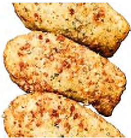
Madeleine salée pesto

Pastèque melon et feta, fromage Grecque à l'huile de cameline et menthe citronnée-Fregola Sarda et lentilles vertes à la Grecquoise (Feta, concombre, tomate, oignon rouge, olive, origan) (Tapenade tomate olive)-Muesli de chou-fleur et brocoli à la grenade, pulpe d'avocat, tomate, jalapenos et coriandre-Taboulé d'épeautre au citron confit, herbes fraîches, tartare de tomate et piquillos (Tapenade de poivron)-Crème de chou-fleur glacée, tartare de pomme de terre et saumon fumé au citron, perles d'Arénkha-Salade sucrine et aiguillette de poulet façon César-Tomate Datterino et mozzarella fior di latte, pesto verde-Burratina et gnocchetti sardi, tomates confites, olives, cébettes à la noix de pécan (Tapenade tomate olive)-Filet de caille et moutarde à l'estragon, pommes grenailles, haricots verts, tomates et artichauts confits aux noix, crème d'oignons grillés