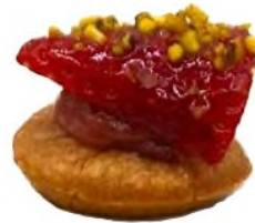
Sablé breton fraise, confit de rhubarbe