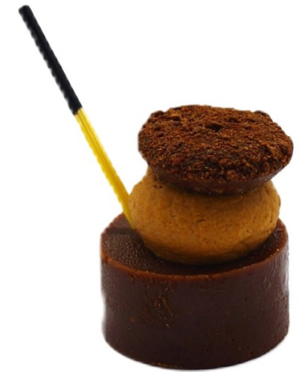
Palet chocolat au miel de Garrigue