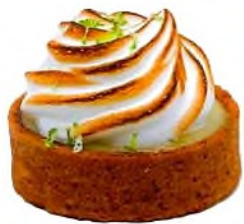
Tarte citron, chantilly basilic