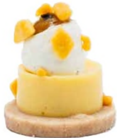
Crousti coco passion, confit crunchy exotique