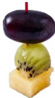
Brochette de fruits frais de saison