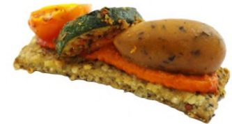
Finger de légumes façon tian, pesto de poivron rouge