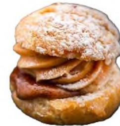
Paris Brest cœur coulant, praliné 69% de fruits