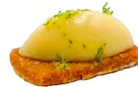
Quenelle citron, râpé de citron vert