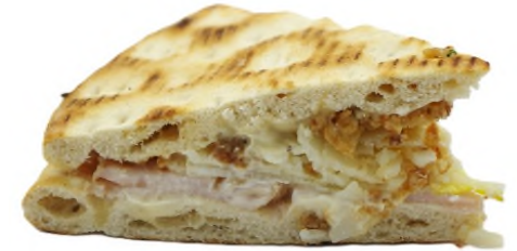
Pain nordique, dinde fumée façon César