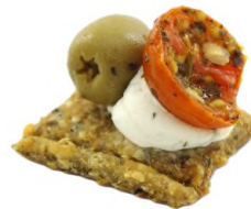
Sablé quinoa avoine, fromage battu ail et fines herbes, tomate cerise confite et olive