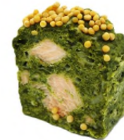
Cake moelleux thon et saumon à l'aneth, semoule de citron confit 350 g (Environ 15 tranches)