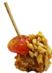
Pic de poulet façon mafé