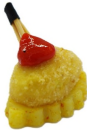
Maïs et pomme de terre, gel de piquillos