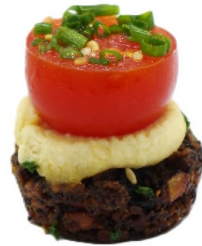
Sablé 100% végan, houmous de pois chiche enrichi au sésame et tomate cerise fraîche