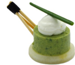
Pomme granny et petits pois façon mojito