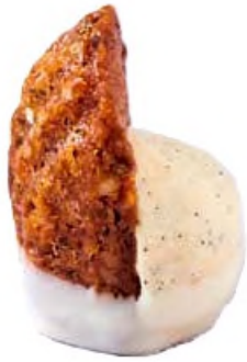
Biscuit noix, crème brûlée double vanille bourbon