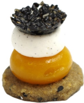
Harmonie de sésame noir et mangue