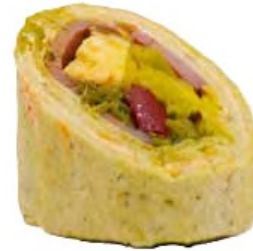
Wrap poulet, bacon de boeuf et feta sauce chimichurri, crème cheese au paprika et chou aux épices