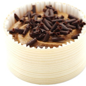
Mousse chocolat pure plantation passionato 62%