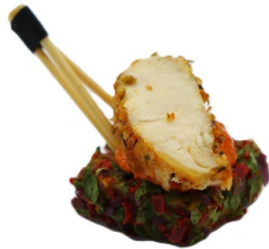
Paëlla poivron piquillos au poulet