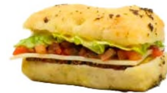
Mini focaccia PSTC (Pastrami, sucrine, tomate et comté), mayonnaise moutarde au curry et miel