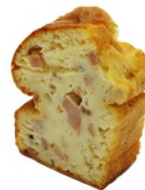
Cake tomate, feta et olive 350g ( Environ 15 tranches)