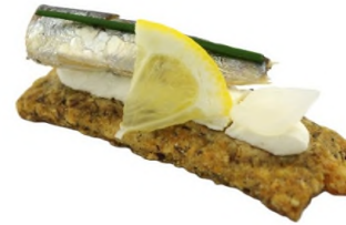
Tarte fine de petite sardine, pickles d'oignon grelot et citron jaune