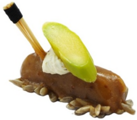
Filet de caille glacé au jus de veau, crème de raifort et asperge verte au tournesol