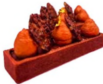
Tarte chocolat, croquant de cacao