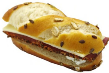
Malicette, jambon de boeuf poivré à l'emmental, fromage frais et cornichons