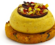
Sablé grué cacao, ganache foie gras, tuile aux mendiants