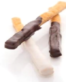
Paille feuilletée au chocolat blanc & chocolat noir