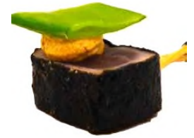
Saku de thon nori shiso, baume tom yum