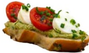
Tapas tomate cerise, perle de mozzarella au crémeux pesto