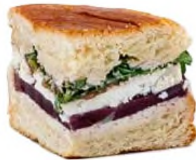
Roll feuilleté, chèvre figue violette et noix, canard confit au piment d'espelette