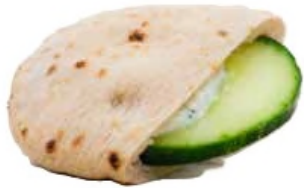
Mini pita, tzaziki concombre