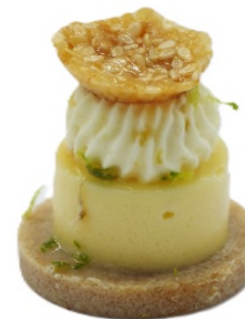
Crousti sésame et crémeux yuzu