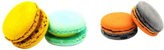
Macaron menthe glaciale - Macaron citron - Macaron pistache - Macaron spéculoos - Macaron caramel beurre salé

Les Petits Macarons – Les Petits Moelleux – Les Pailles Feuilletées – Les Cakes