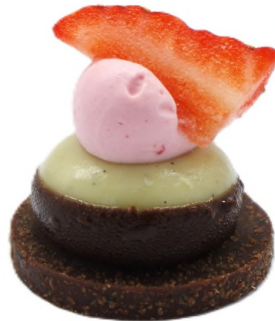
Banana split, croustillant chocolat et chantilly fraise