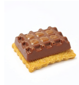
Petit écolier, gianduja praline intense