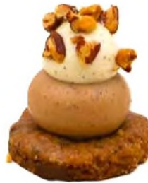
Douceur de cookie et noix de pécan