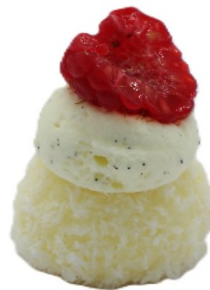
Mini pavlova coco, vanille et framboise