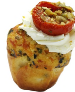
Mini cupcake salé à la ciboulette, cream cheese mangue curry et olive de kalamata