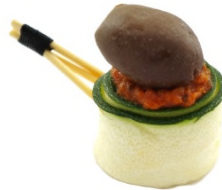
Roulé de courgette et chèvre frais à la piperade, olive Taggiasche