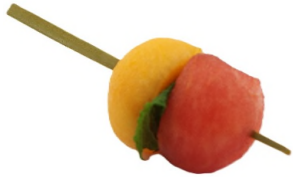
Brochette melon, pastèque et menthe fraîche