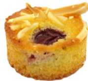
Petit moelleux coc, pistache, griotte, amande, pépites de chocolat