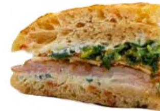
Schiacciata, jambon de dinde fumée à la ricotta, pesto rosso aux olives, pecorino, asperge et roquette