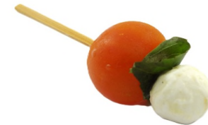
Pic tomate fraîche, basilic et mozzarella fleur de lait