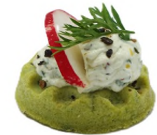
Gaufrette moutarde estragon, fromage frais échalote et radis rose