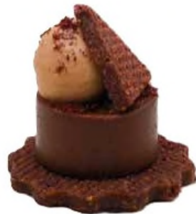
Tarte chocolat à l'épice sumac