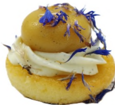
Charlotte mirabelle, chantilly vanille bourbon