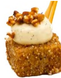
Riz au lait, caramel tendre et sarrasin soufflé