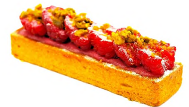
Sablé breton, fraise confit de rhubarbe