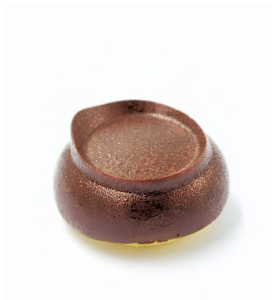
Pim's agrûmes, clémentines de Corse