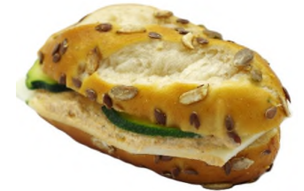
Malicette, tomate olive et courgette à la tomme de brebis