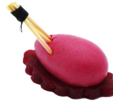
Le 100% betterave façon cheesecake