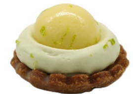
Tarte citron basilic